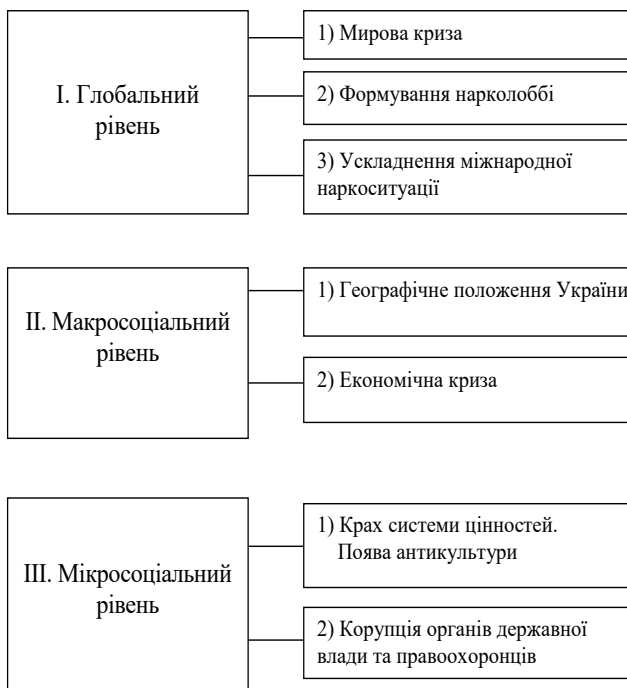
Рис. 1. Фактори впливу на процес поширення наркотичних засобів

до органів державної влади, ускладнення відносин між суспільством і особистістю та збільшення кількості правопорушень. Кризові явища ведуть до різкого збільшення числа стресових ситуацій, вихід з яких у більшості випадків люди бачать у вживанні наркотичних засобів, алкоголю, що дозволяє їм уникнути наявної реальності.