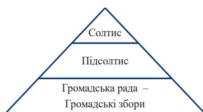
Рис. 2. Структура органів влади у громаді колективної гміни

У невеликих громадах – менше 200 мешканців – ухвалюючим органом ставали громадські збори. Такими в повіті були в межах гміни Красів – громада Ліндельфельд (133 мешканці), гміни Остров – Кросно Нове (134 мешканці), Розенберг (179 мешканців), Загородкі (121 мешканець). Кількість радних у громадській раді залежала від кількості мешканців у громаді.